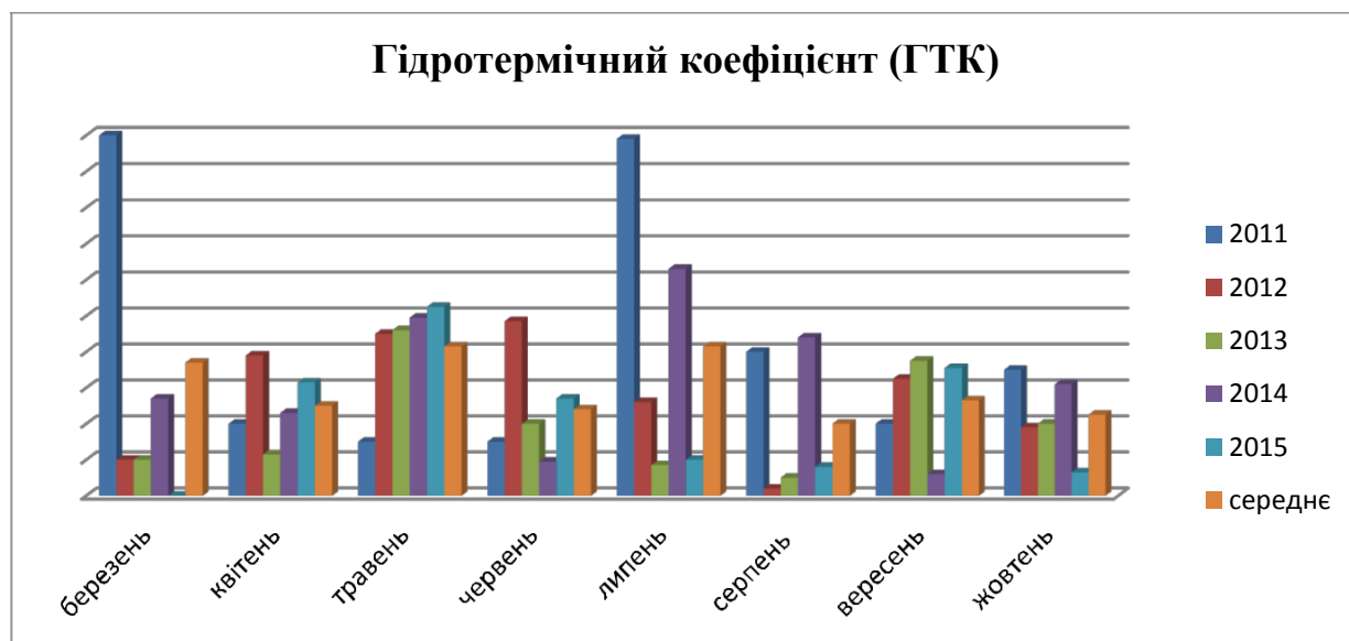
Рис. 1 – Господарська оцінка клімату низинної зони Закарпаття

Аналізуючи гідротермічний режим низинної зони Закарпаття можливо констатувати, що вегетаційний період ароматичних рослин протягом 2011 - 2016 років характеризувався сильно посушливими періодами та періодами нестійкого зволоження (рис. 1).