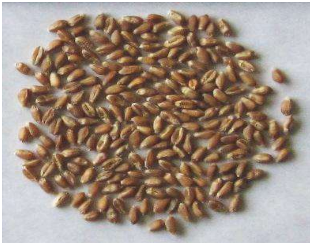
Рис. 6. Зерно пшениці сорту Ювівата 60

Сорт Ювівата 60 пластичний до високих доз мінеральних і органічних добрив; характеризується підвищеною стійкістю до вилягання (8,8 балів). Встановлено, що за умов високого агрофону (попередник – зайнятий пар; фон мінеральних добрив – N 90 P 90 K 90 ) на чорноземі вилугуваному, при урожайності 8,5 т/га, маса 1000 зерен становить – 53 г, а на дерново-підзолистих ґрунтах, при урожайності – 6,7 т/га, маса 1000 зерен – 50,5 г (рис. 6). Сорт Ювівата 60 відзначається високою стійкістю до бурої іржі (8,5 б.) та твердої сажки (8,7 б.).