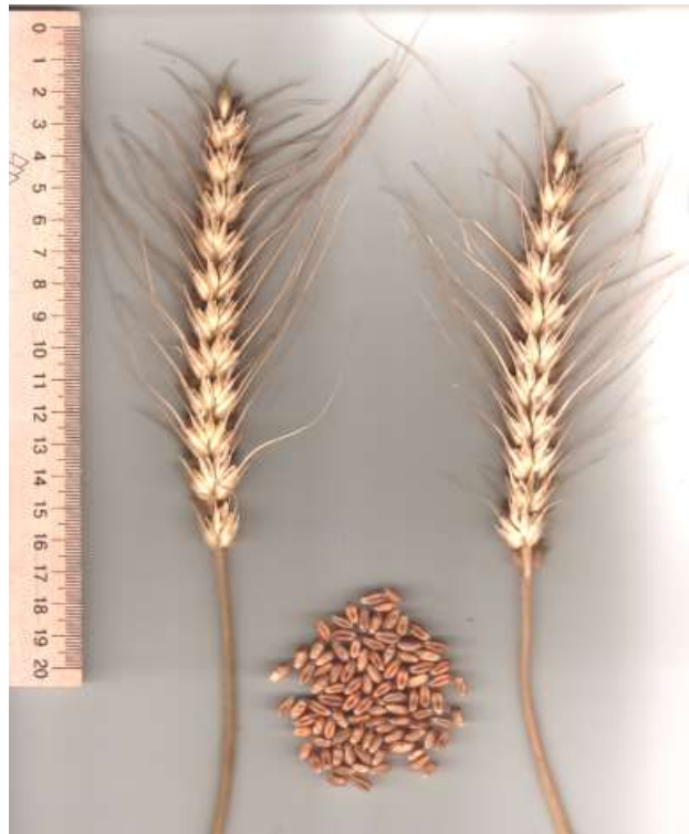
Рис. 5. Насіння і колос рослин сорту Ювівата 60

Характерною ознакою зернівки є неглибока борозенка, що зменшує травмування зерна під час обмолоту, запобігає висипанню його з колоса під час повного достигання та ураженню шкідниками з колючо-сисним ротовим апаратом та збудниками хвороб. Натура зерна – 785–820 г/л. Маса 1000 зерен з бункера комбайна – 47 г, після кондиціювання (очистки) – до 60 г (табл. 8).