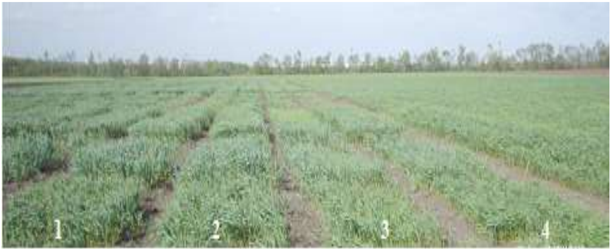
Рис. 4. Фенофаза трубкування рослин сортів пшениці (Лісостеп, 2011 р., II декада травня): 1, 2 – Ювавіта 60; 3,4 – Зірка Носівська

Хоча весняна фенофаза кушіння пшениці не є критичною для її росту й розвитку, проте дефіцит вологи у цей період може зменшувати формування загальної кількості стебел, а у фазу колосіння–цвітіння може призводити до низької озерненості колоса, під час формування й наливу зерна – навіть до його дрібнозернистості і щуплості. За даними низки авторів [ 11, 12 ] у період весняно-літньої вегетації в зоні Лісостепу потреба рослин пшениці у волозі становить 230–330 мм. Починаючи з відновлення вегетації до фенофази виходу в трубку рослинам озимих зернових потрібно лише 60–86 мм вологи, від фенофази виходу в трубку до цвітіння – 110–145 мм, від цвітіння до воскової стиглості – 60–100 мм [ 11 ].