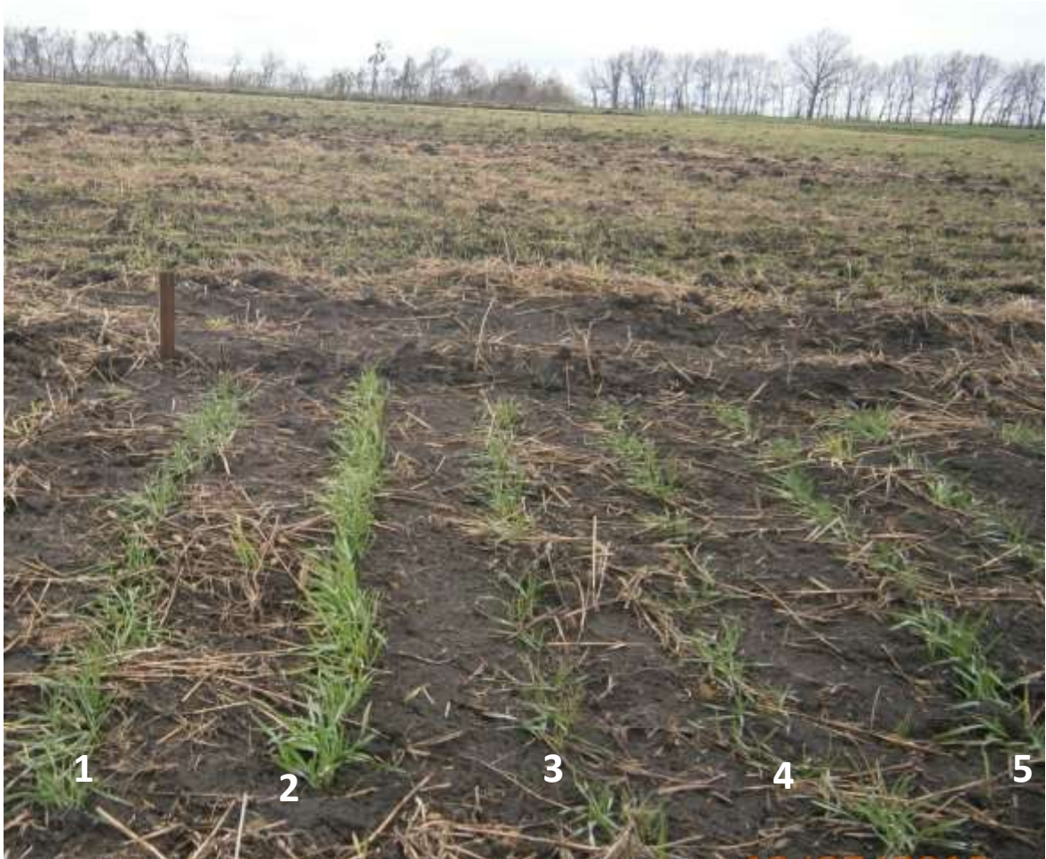
Рис. 3. Відновлення весняної вегетації рослин (Лісостеп, дослідне поле ННДЦ БНАУ, III декада березня, 2017 р.: 1, 2 – Придеснянська напівкарликова; 3, 4, 5 – Ювівата 60

Впродовж осінньої вегетації у рослин розвивається потужна коренева маса за відносно повільного нагромадження наземної частини, що є характерною генетичною ознакою рослин полісько-лісостепового екотипу, тим самим забезпечуючи їх стійкість до зимово-весняного періоду. Як було зазначено вище, рослини Ювівати 60 характеризуються сповільненим темпом розвитку наземної частини (листоків, стебел) як під час осінньої, так і під час весняної вегетації, що відмічається візуально (рис. 3).