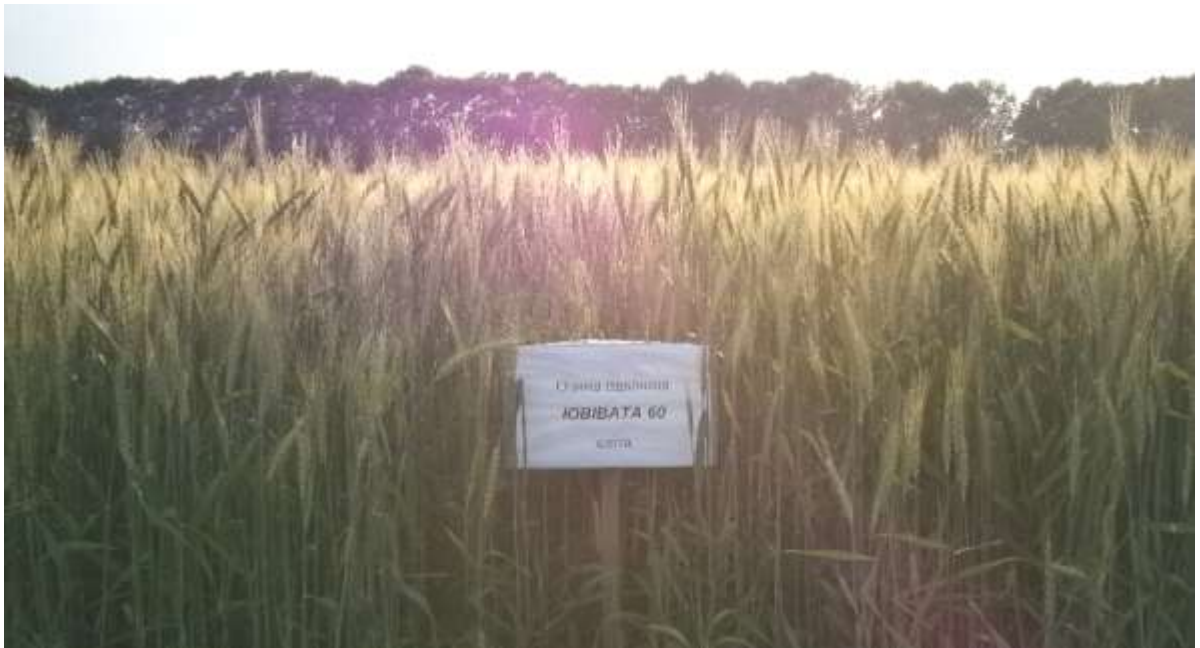
Рис. 7. Фітоценоз пшениці м'якої озимої сорту Ювівата 60, стаціонар Носівської селекційно-дослідної станції МП НААН, 2018 р.

Рекомендована норма висіву для цього сорту є, за умов високої культури землеробства, 4,0–4,5 млн схожих зерен/га. У разі середніх та пізніх строків сівби норму висіву потрібно збільшувати до 6 млн/га. Оптимальна глибина загортання насіння цього сорту на середніх і важких за механічним складом ґрунтах – 3–3,5 см, а на легких ґрунтах – 3,5–4,5 см.