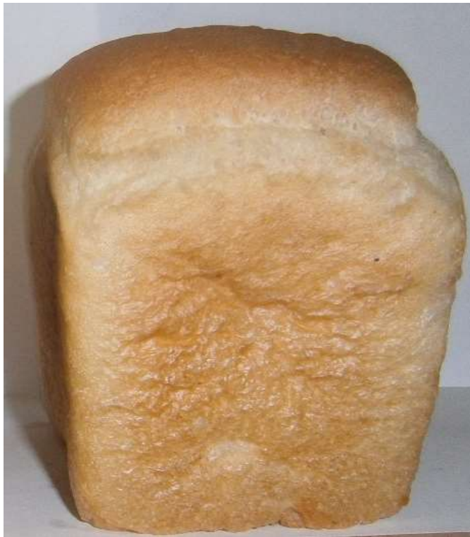
Рис. 8. Хліб, випечений із пшениці м'якої сорту Ювівата 60

Висновки. Для умов Лісостепу та Полісся створено конкурентоспроможний сорт пшениці м'якої озимої «Ювівата 60».