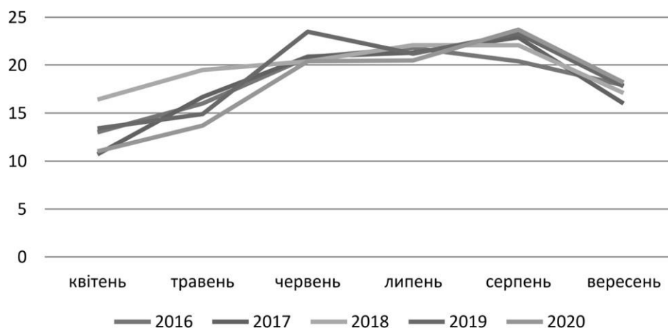
Рис 1. Середньодобова температура повітря за вегетаційний період 2016-2020 рр.

Початок вегетаційного періоду (набухання плодових бруньок) відбувається у сортів груші та яблуні – в другій та третій декаді березня, коли середньодобова температура сягає 11^{\circ}\text{C} . (рис 1).